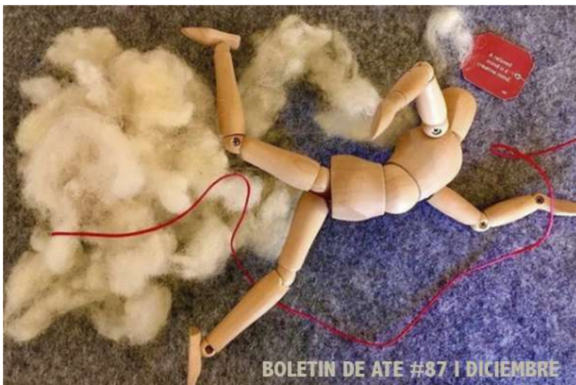
Eglé Casagrande, A relaxed mind is a creative mind , 2020

Estamos de vuelta con el último Boletín de 2020 lleno de aportaciones y resúmenes de los eventos que han ido ocurriendo. Esperamos que, si no has podido asistir, por lo menos podamos acercarte un poco las actividades de los últimos dos meses.