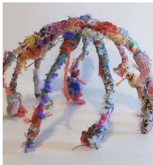
Home: refuge, castle or cage?